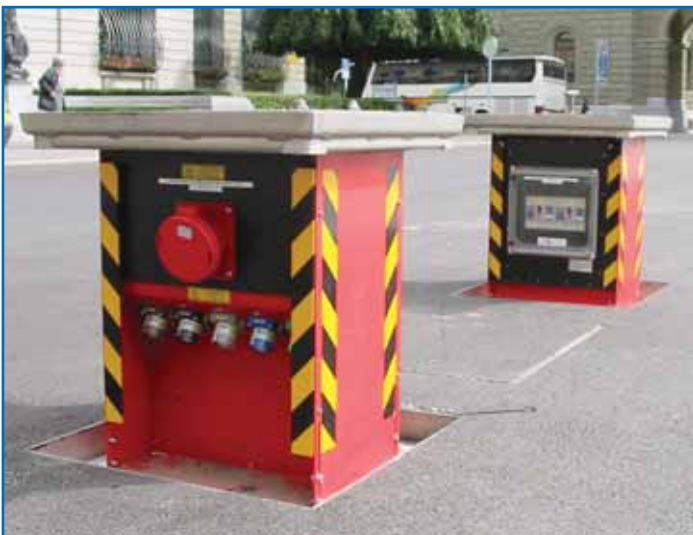
Ausfahrbare, gasfederunterstützte Unterflurelektranten

⇒ GIFAS Unterflurelektranten ⇐ Die saubere und diskrete Energieversorgung !